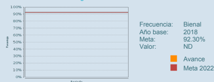
P01.3 Porcentaje de estudiantes de educación básica que forman parte de una familia beneficiaria del Programa que permanecen en educación